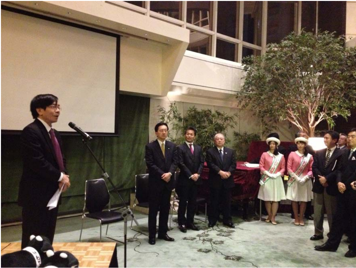
於酒會開始時致辭的石井署理總領事。