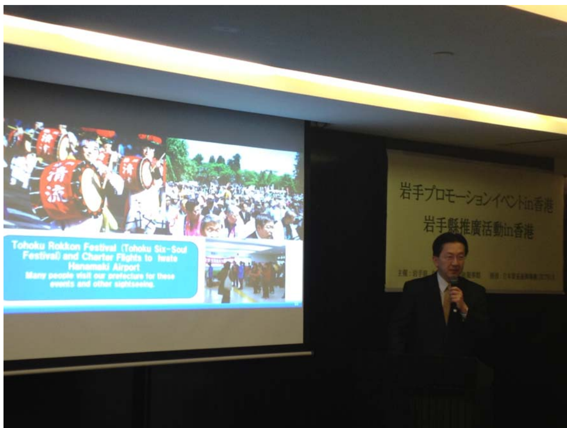
闡述岩手縣內之復興情況、介紹岩手縣特產和旅遊景點的達增知事。