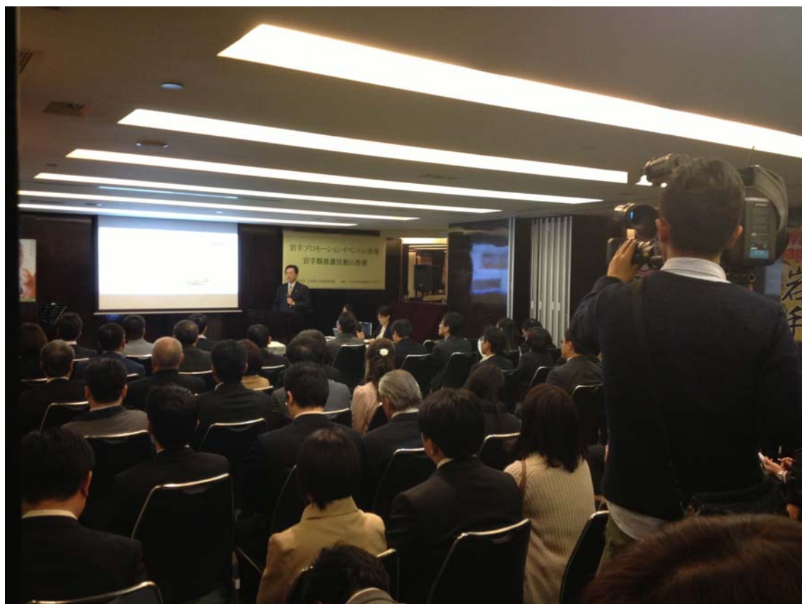
熱心地聆聽達增知事演說的來賓和傳媒人士。是次活動的參加者就香港能為日本重建所給予的支援提供了許多寶貴的意見和提議。