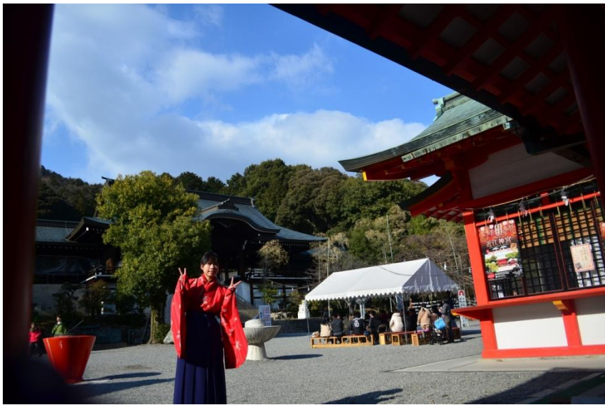
(2014年1月11日攝於 滋賀縣近江神宮 - 歌留多的聖地)